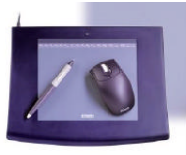
Tableta digitalizadora WACOM