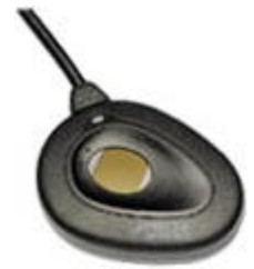
Sensor PB modelo Precise 100-A