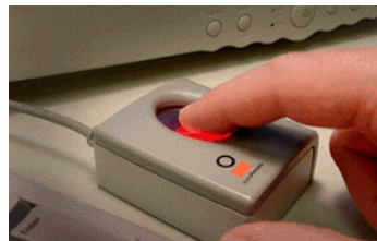
Sensor DP (Digital Persona)